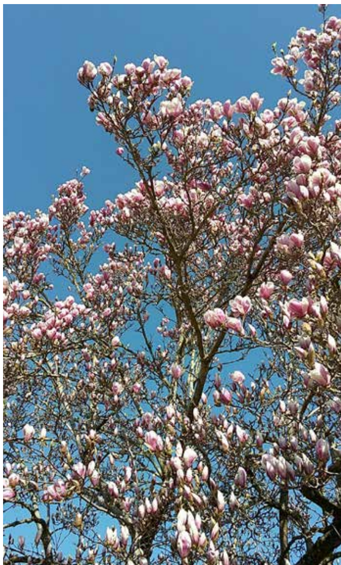
Magnolia, rte de Crevel 98, le 20 mars 2020.