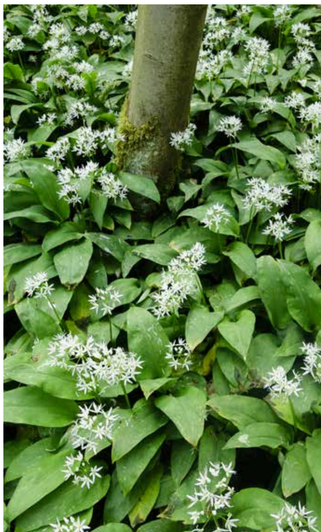
Tapis d'ail des ours au printemps au bord du ruisseau