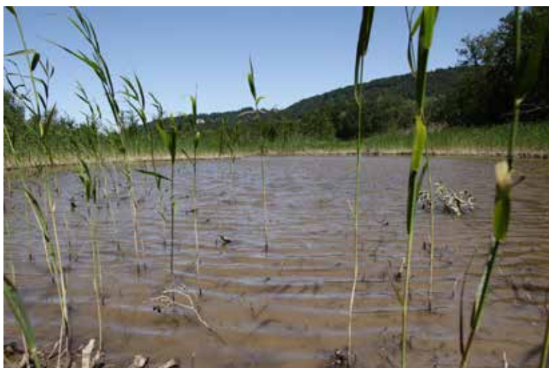
Nouvel étang et bassin de déversement.