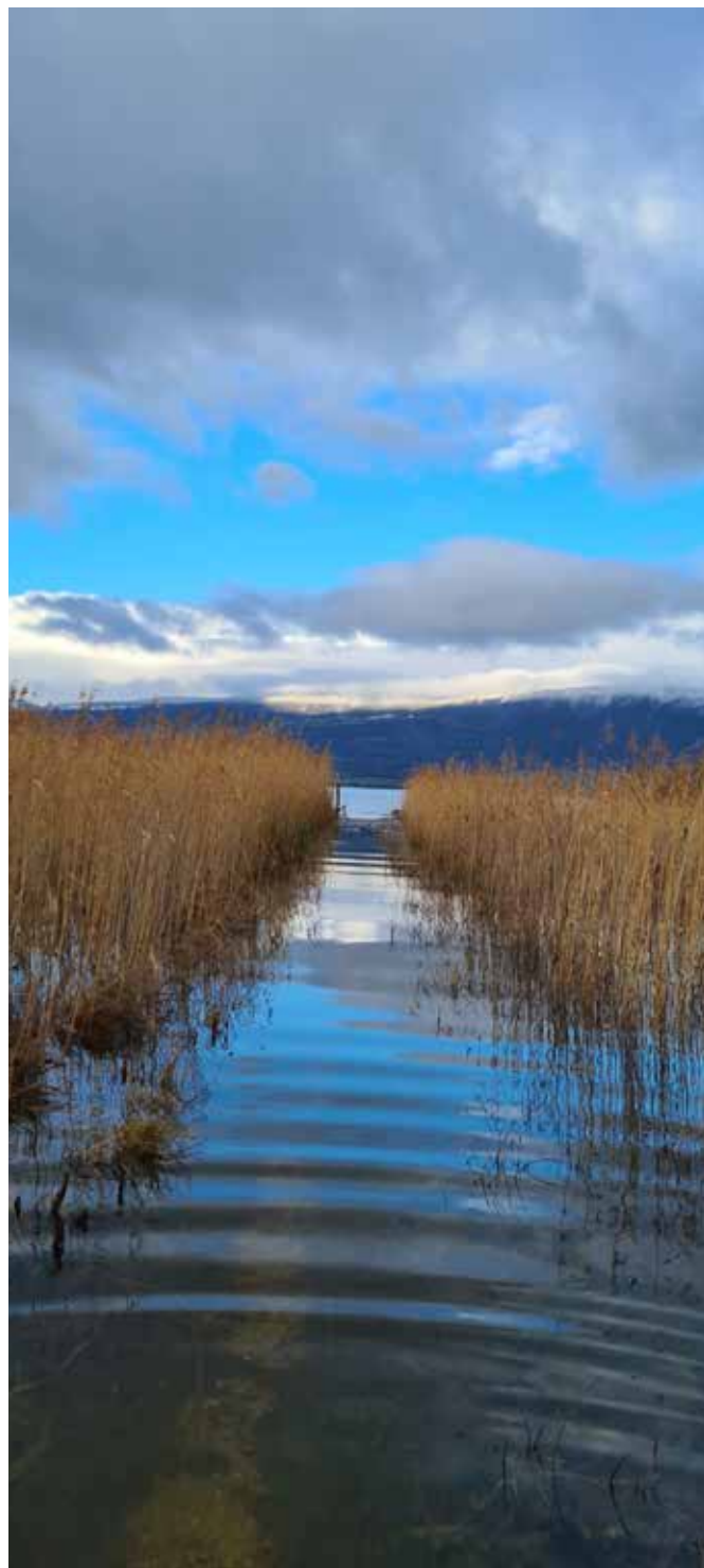
Le 14 décembre 2023. Avec des bottes de pêcheurs peut-être...