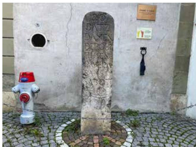
Le plus ancien panneau de circulation connu en Suisse.

Nous avons visité le château qui a l'une des plus anciennes tours rondes de Suisse, l'église gothique originale avec ses sculptures intéressantes du début du 16ème siècle et la vieille ville pittoresque avec l'Hôtel de-Ville et d'autres bâtiments élégants de style baroque tardif. Nous avons également admiré le plus ancien panneau de circulation connu en Suisse. La villa et la petite ville, à côté desquelles on passe généralement sans s'arrêter, méritaient bien cette visite qui s'est terminée comme il se doit autour d'un verre de vin de la région.