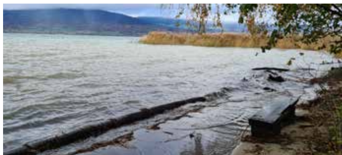
Le niveau du lac au 17 novembre 2023. Inquiétant, mais sans plus.

A la mi-novembre, les pluies tombèrent en continu et le niveau du lac devint inquiétant. Les chemins d'accès au lac furent fermés, mais il n'y eut pas de gros dégâts à déplorer. Notre soulagement fut de courte durée car, quelques semaines plus tard, alors que les préparatifs de Noël battaient leur plein, de fortes précipitations tombèrent sur des terrains gorgés d'eau, le lac atteignit sa cote d'alerte et se mit à déborder.