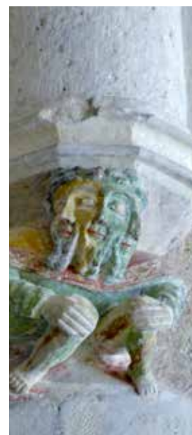
Église: Audacieuse voûte suspendue avec culots en forme de personnage à trois têtes.

Après une histoire mouvementée et la guerre de Bourgogne, la petite ville médiévale d'Orbe est devenue une seigneurie bernoise et fribourgeoise.