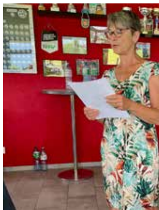
AG 2023, souvenirs