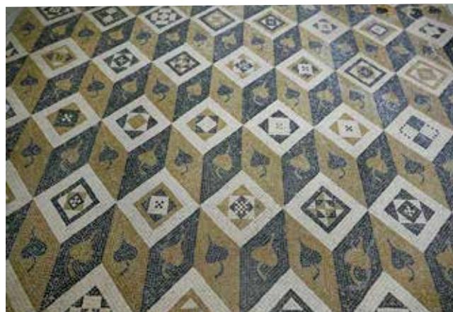
Mosaïques, dernier quart du 2 ème siècle : les dieux de l'antiquité et des cubes tridimensionnels

Les dimensions de cette maison de maître sont énormes : installé sur une terrasse artificielle de 2,5 hectares, entouré de jardins, se trouvait un palais dont la façade longue de 230m profitait de la situation panoramique. A cela s'ajoutaient de vastes surfaces agricoles de plusieurs centaines d'hectares. Le palais, appelé correctement villa en latin, était organisé autour de deux grandes cours intérieures. Des vestiges de peintures murales et de revêtements en marbre, deux thermes, des fontaines, des jardins, mais surtout toute une série de mosaïques remarquables, témoignent du luxe de l'aménagement. Outre des motifs ornementaux décoratifs, des scènes de la mythologie gréco-romaine y sont représentées, comme l'histoire de Thésée et d'Ariane, d'Ulysse, ou encore une magnifique mosaïque de dieux et une description de la vie rurale. Au vu de la taille de la villa et de son luxe, on peut se demander qui pouvait s'offrir une telle demeure en Helvétie. Les thèmes des mosaïques témoignent de l'éducation du maître d'ouvrage, un Gaulois devenu riche ? un Romain qui s'est installé ici ? Nous ne le savons pas. Après les invasions alémaniques vers 260, la villa, une construction méditerranéenne, fut abandonnée et tomba en ruine après à peine 100 ans.