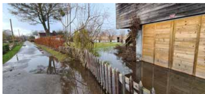
Le niveau du lac au 16 décembre 2023. Les eaux continuent de monter...

... et ce que nous redoutions tous finit par arriver, à savoir la décision de la Commune de couper la station de pompage : « Suite aux intempéries de ces derniers jours et de la montée des eaux du lac, le système d'évacuation des eaux usées des secteurs Crevel, Pointus, route du Port et Sous-la-Gare est mis hors service pour une période indéterminée. En plus des crues, l'épuration est surchargée d'eaux claires parasites, etc. Vous êtes priés de ne plus utiliser vos installations privées (toilettes, douche, machine à laver)... Malgré la lente décrue, le système ne pourra pas être remis en fonction avant le début de l'année 2024 ».