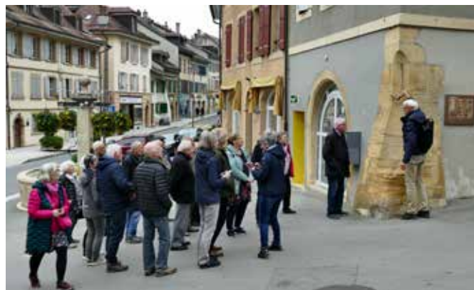
Présentation du pilori...

Le château, agrandi aux XII e et XIII e siècles, dominait le goulot d'étranglement de l'importante route reliant la France à l'Italie par le Grand-Saint-Bernard, à l'instar du château de Chillon, une situation qui se remarque encore aujourd'hui. En tant que lieu d'approvisionnement et d'infrastructure du château, le bourg s'est développé sous la forme d'une agglomération organisée en deux rangées. On y a conservé un pilori, rare monument juridique.