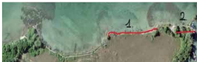
1. 170 m reconstruit à neuf

Le tracé depuis le pont des Pointus sera quant à lui modifié car l'érosion à cet endroit est trop avancée. Un passage en ligne droite, du pont aux passerelles, sera aménagé à travers les arbres (2).