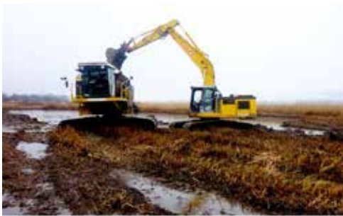
Bagger am Ausheben eines Teiches.

In der Schilfzone von Cheyres ist eine grossflächige Abdeckung geplant, in einem Gebiet, das stark verlandet. Die Abdeckung erfolgt zusätzlich zur regelmässigen Schilfmahd und dient der Wiederherstellung der Teiche, die sich im Laufe der Zeit unvermeidlich füllen. Ohne diese Massnahmen würden die Teiche verschwinden und mit ihnen die gesamte spezifische Fauna und Flora dieser aquatischen Lebensräume.