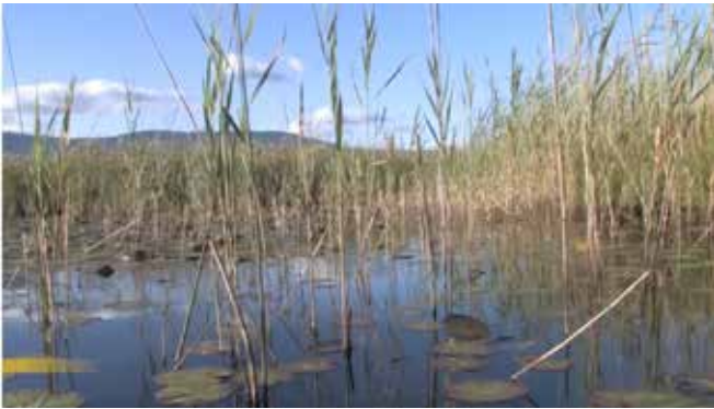
Ohne Abdeckung füllen sich die Teiche unaufhaltsam!