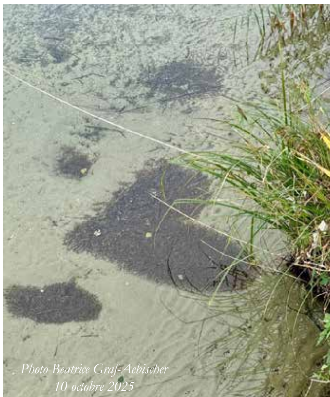
10 octobre 2025

24. Oktober 2026, Nachmittag Save the date!