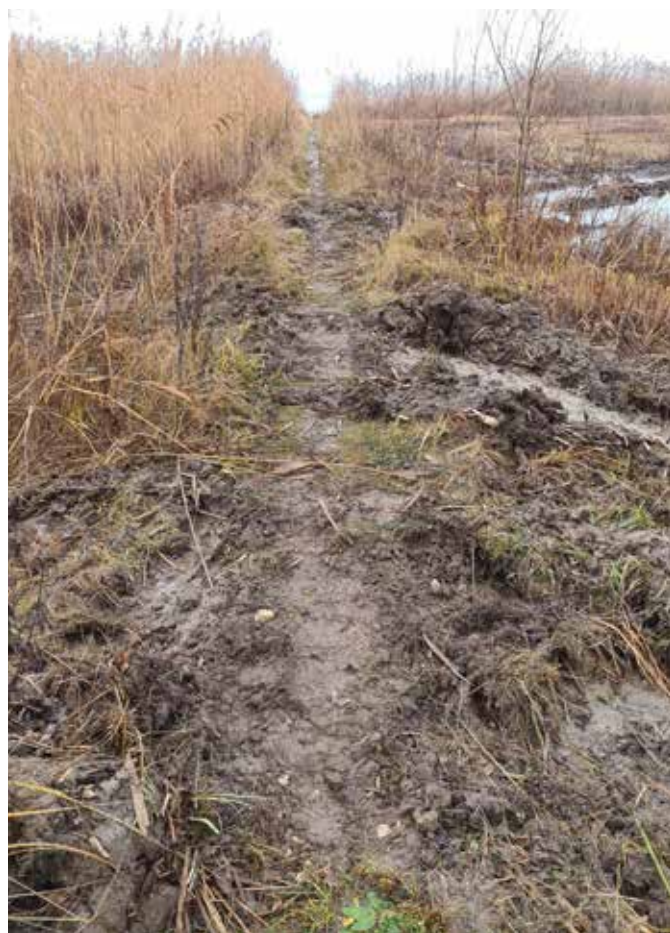
Après le passage de l'Elbotel et quelques coups de pioche...

Le secteur de fauche s'est arrêté au niveau du petit chemin menant à la plage (entre les chalets 146 et 144). Par contre la machine, elle, a poursuivi sa route en direction d'Yvonand pour ressortir de la roselière dans le passage prévu à cet effet, laissant derrière elle notre petit chemin en partie défoncé sur une bonne dizaine de mètres.