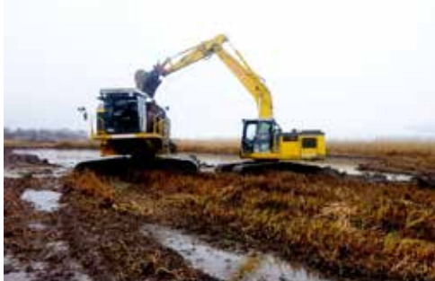
Pelle mécanique utilisée pour le décapage.

Un décapage est prévu dans la roselière de Cheyres, dans une zone qui s'embaumonne fortement. Le décapage se fait en plus de la fauche régulière des roseaux et a pour but la restauration des étangs qui se comblent inéluctablement au fil du temps. Sans ces décapages, les étangs disparaîtraient et, avec eux, toute une faune et flore spécifiques de ces milieux aquatiques.