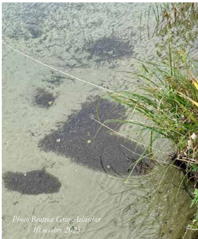
10 octobre 2025

24 octobre 2026, après-midi Save the date!