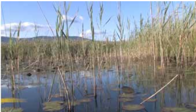
Sans décapage, les étangs se referment inéluctablement.